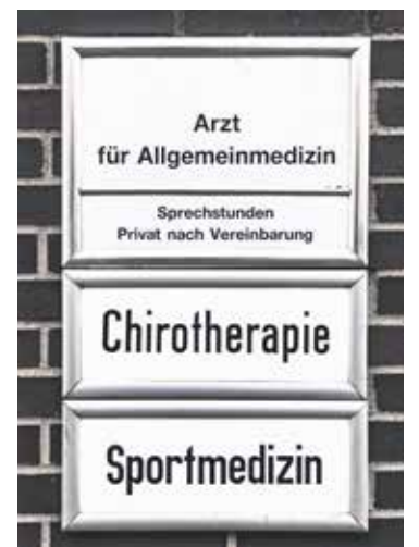
Erst in die hausärztliche Praxis, dann zu Spezialist*innen? Das sieht das Hausarztmodell vor.

Hinzu kommt, dass nicht jede Praxis dieses Modell anbietet, womöglich ist also ein Wechsel der hausärztlichen Versorgung nötig. Wer Interesse am Hausarztmodell hat, bekommt bei der Krankenkasse mehr Informationen zu teilnehmenden Praxen. str/dpa