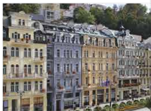
Außenansicht, 4+ ASTORIA Hotel & Medical Spa

Freizeit/Kur/Unterhaltung: Im neuen Wellnesszentrum des Hotels stehen Ihnen ein Schwimmbad (8 x 4 m, ca. 31°C) mit Gegenstromanlage und Massagedüsen, verschiedenen Saunen und Erlebnisduschen zur Verfügung. Hier erhalten Sie zudem die wohltuenden Anwendungen, für die das Hotel das natürliche Mineralwasser der Karlsbader Sprudelquelle nutzt.