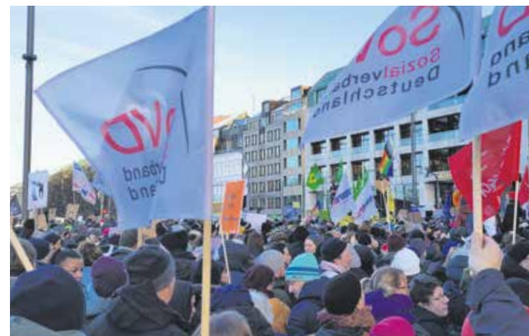
Am 28. Januar fand die zweite Großdemo in Hamburg mit geschätzten 180.000 Menschen statt.