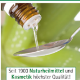
Seit 1903 Naturheilmittel und Kosmetik höchster Qualität!