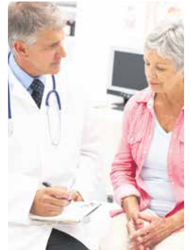
Auch Rentner*innen müssen ab diesem Monat mehr Geld für die Krankenversicherung zahlen.

So wie beim regulären Krankenkassenbeitrag übernimmt die Rentenversicherung auch beim Zusatzbeitrag die Hälfte der Kosten – analog zum Arbeitgeber für berufstätige Versicherte. Hat eine Krankenkasse ihren Zusatzbeitrag also beispielsweise um 0,8 Prozent erhöht, erhalten Rentner*innen 0,4 Prozent weniger Rente. Diese leitet die Rentenversicherung direkt an die jeweilige Krankenkasse weiter. Bei einer Rente von 1.000 Euro führt das in diesem Beispiel zu einer um 4 Euro niedrigeren Auszahlung. str