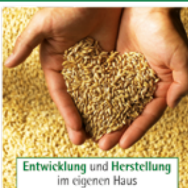
Entwicklung und Herstellung im eigenen Haus