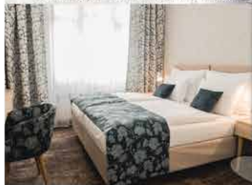
Zimmerbeispiel, 4+ ASTORIA Hotel & Medical Spa