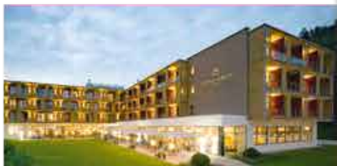
Außenansicht, 4++ Hotel König Albert

Freizeit/Kur/Unterhaltung: Ein Bademantelgang führt Sie vom Hotel direkt zur Soletherme und Saunawelt (gg. Aufpreis) Bad Elster sowie zur weitläufigen Bade- und Saunalandschaft im historischen Albert Bad. Hier erwarten Sie unter anderem unterschiedliche Innen- und Außenbecken mit einer Wassertemperatur von 25°C bis 35°C mit Massagedüsen, Sprudeln und vielem mehr.