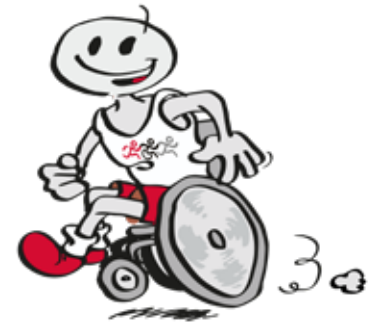
Grafik: Matthias Herrndorff

Derzeit laufen die Planungen für das Rahmenprogramm mit vielen Ständen, Unterhaltung und Gesprächen auf der Bühne. Für die gewohnte Inklusionslauf-Atmosphäre mit gelebter Gemeinschaft und Unterstützung und vor allem viel Spaß auf und neben der Strecke sorgen die Teilnehmenden. str