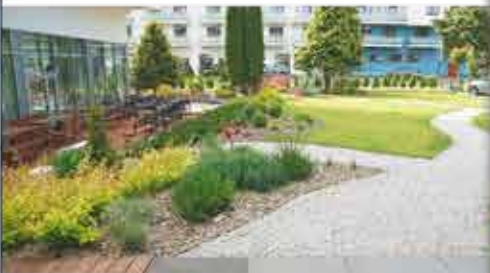
Hotelgarten, 3++ Hotel Koral Live

Freizeit/Kur/Unterhaltung: In der hoteleigenen Kur-Abteilung werden Ihnen hochwertige Kur-Anwendungen, wie Massagen, Packungen und Solebäder angeboten. Darüber hinaus verfügt das Hotel über ein Schwimmbad (16 x 6 m, ca. 32°C), Solebecken (12 x 6 m, ca. 30-32°C), zwei Whirlpools, Sauna, Infrarotsauna, Dampfbad und Fitnessraum.