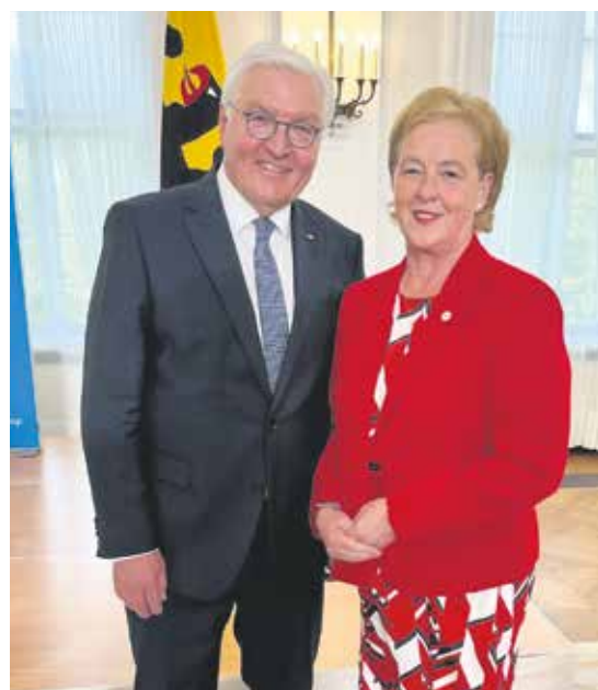
Staatspräsident Frank-Walter Steinmeier und die SoVD-Vorstandsvorsitzende Michaela Engelmeier.