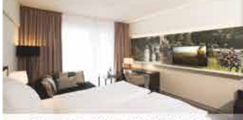
Zimmerbeispiel, 4++ Hotel König Albert