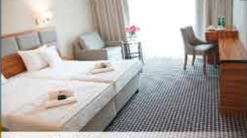
Zimmerbeispiel, 3++ Hotel Koral Live